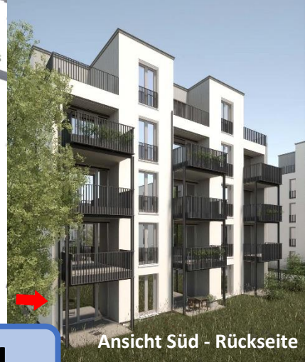
Ansicht Süd - Rückseite