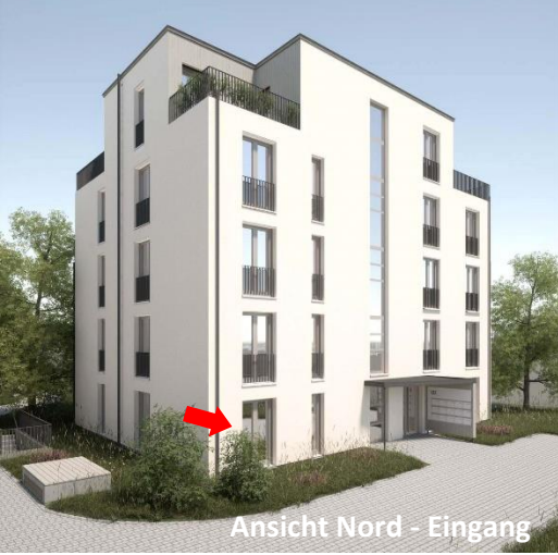
Ansicht Nord - Eingang