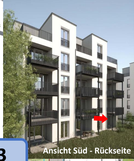
Ansicht Süd - Rückseite