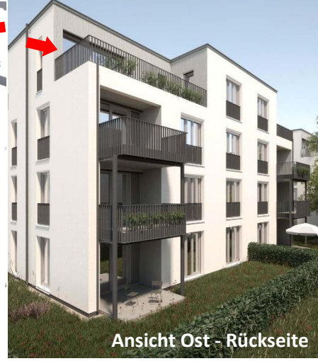
Ansicht Ost - Rückseite