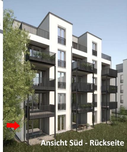
Ansicht Süd - Rückseite