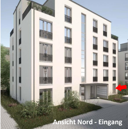
Ansicht Nord - Eingang