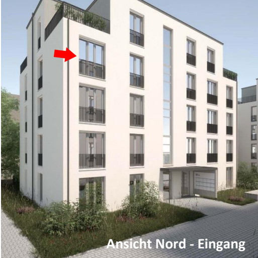
Ansicht Nord - Eingang