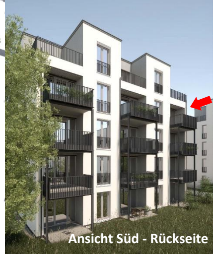
Ansicht Süd - Rückseite