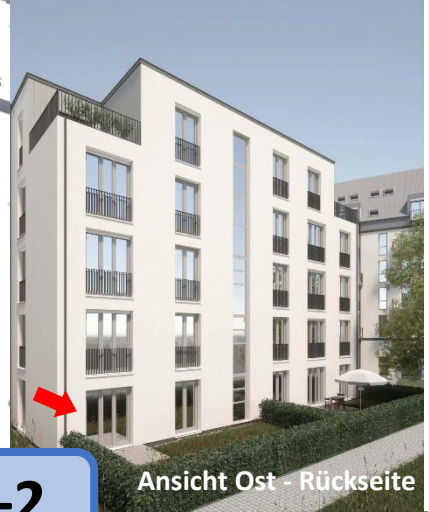
Ansicht Ost - Rückseite