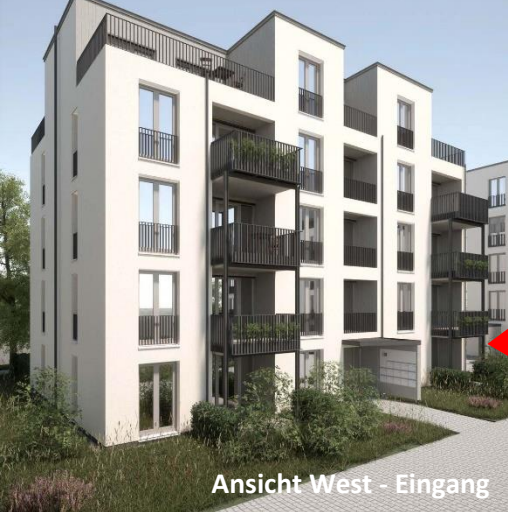
Ansicht West - Eingang